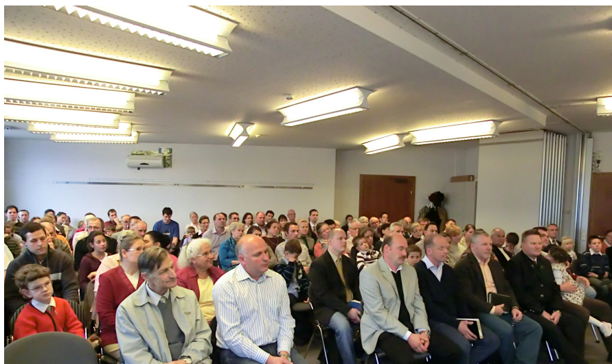
Snímek z Grazu, Rakousko