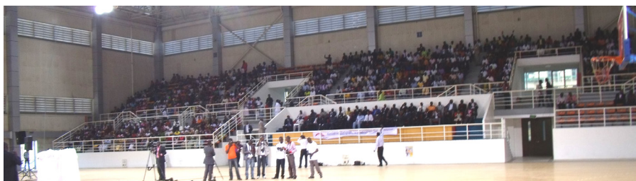
Na obrázku je vidět část velkého shromáždění ve stadionu v Luandě, Angola.