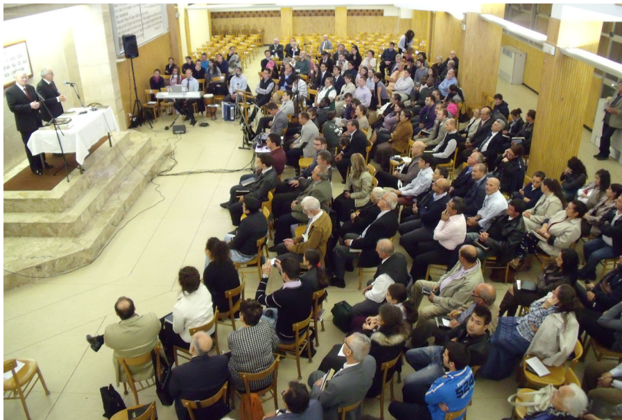
Shromáždění v Římě.