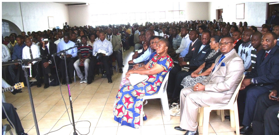
Fotografie ukazuje shromáždění v Johannesburgu.