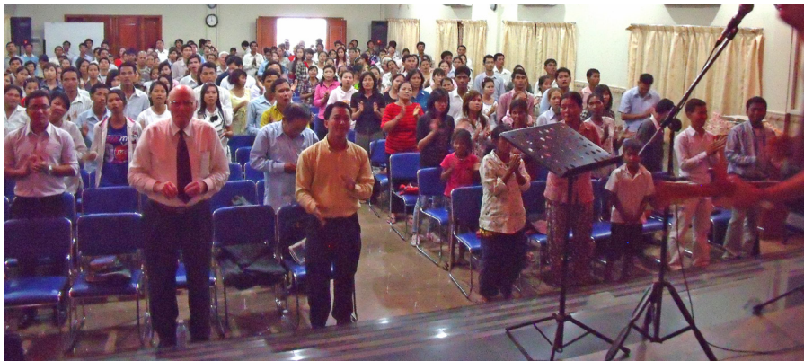
Snímek z Phnom Penh v Kambodži.